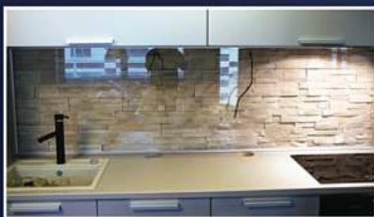
Čirý float bez lakování