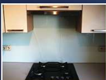
Použití nekaleného skla – prasknutí teplem za sporákem

Tepelná odolnost: Naše skla můžete bez obav umístit za sporák či varnou desku. Kalené sklo odolává teplotním rozdílům až 250°C, zatímco obyčejné sklo pouze 35°C.