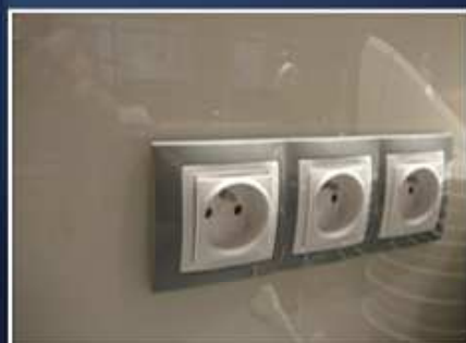
Výřez pro zásuvku