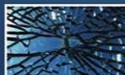
obr. 2b Tvrzené sklo

Mechanická odolnost: Tepelnou úpravou – kalením získá sklo několikanásobně vyšší pevnost a pružnost. Sklo je mnohem odolnější vůči rázům oproti běžnému sklu. Kalená skla spadají do řady bezpečnostních skel, protože se po rozbití rozsypaná na malé kostičky viz obrázky.