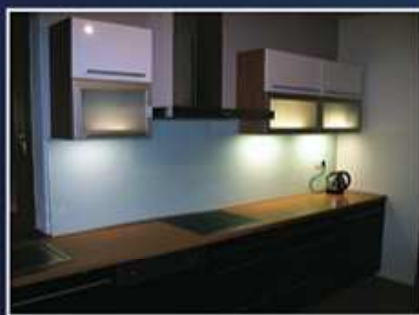
Výřez k digestoři